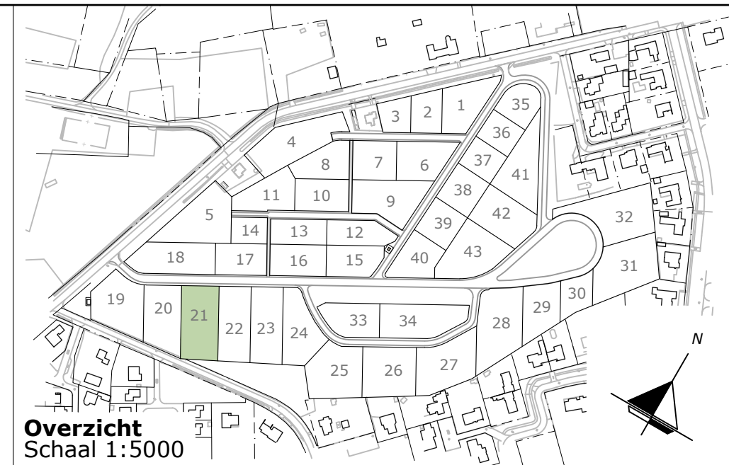
Overzicht Schaal 1:5000