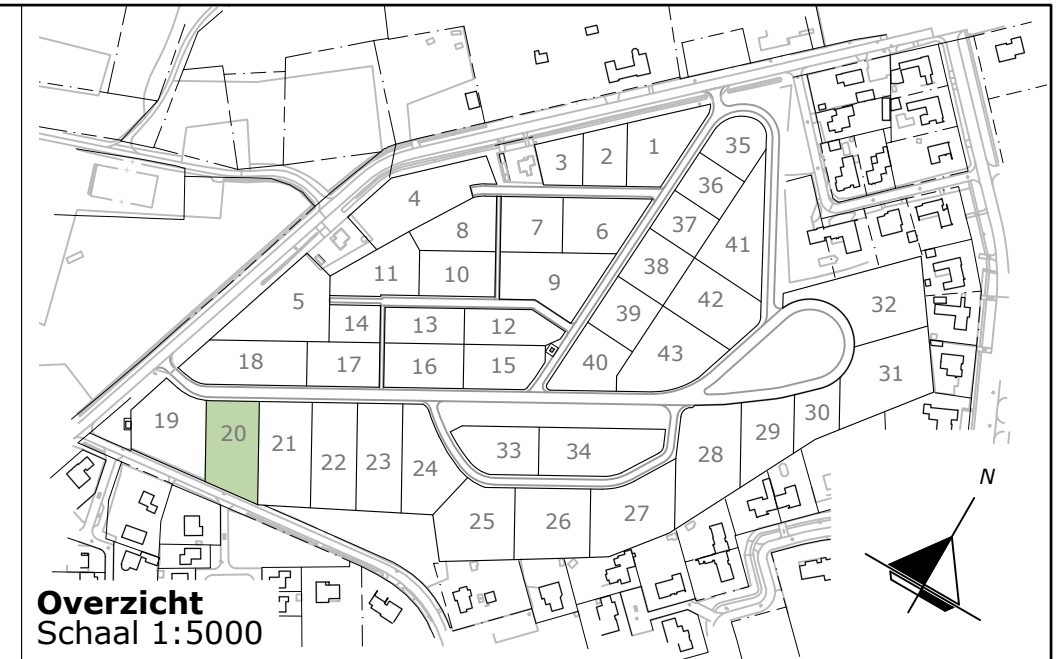
Overzicht Schaal 1:5000